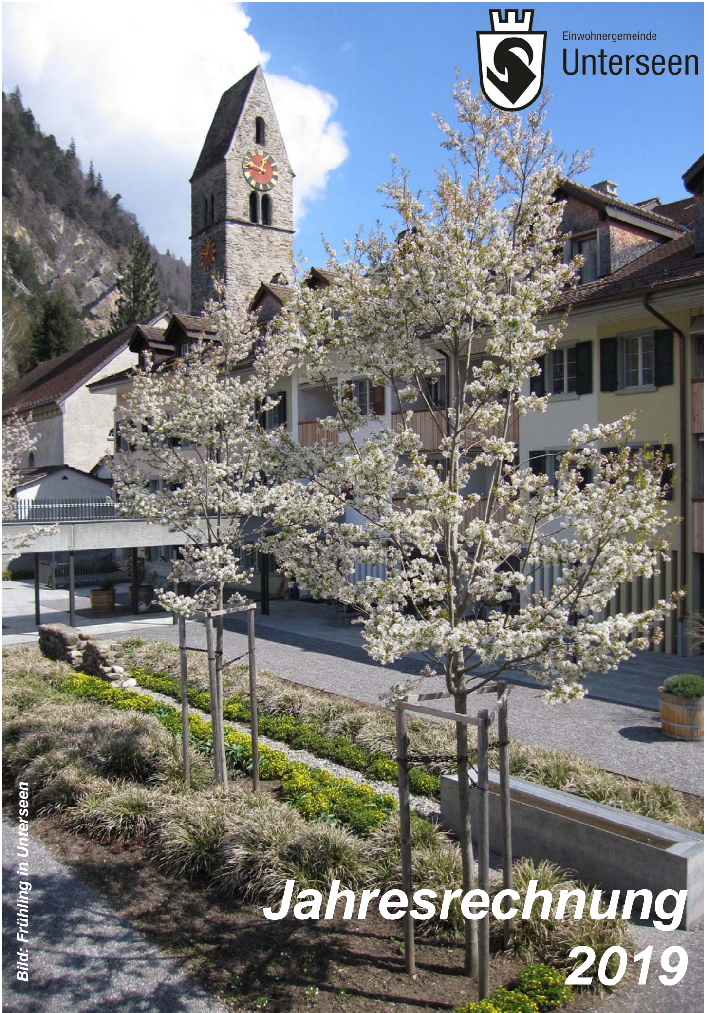
Bild: Frühling in Unterseen